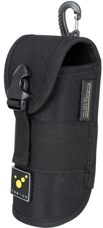
GLASSES TAC Holster