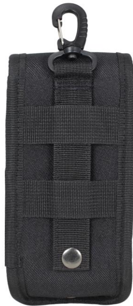
Ansicht Rückseite: MOLLE-kompatible PALS-Befestigung mit Druckknopf-Sicherung