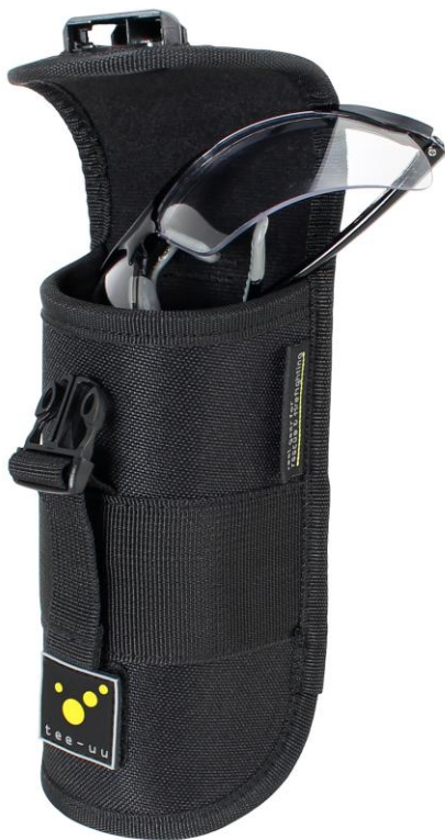
Anwendungsbeispiel: Holster mit Schutzbrille