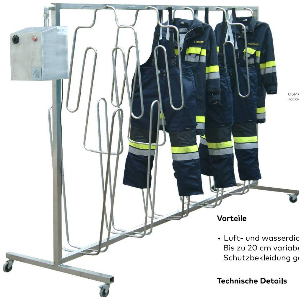
OSMA Fireman für jeweils 5 Jacken und Hosen Jackentrockner zu Hosentrockner längsversetzt